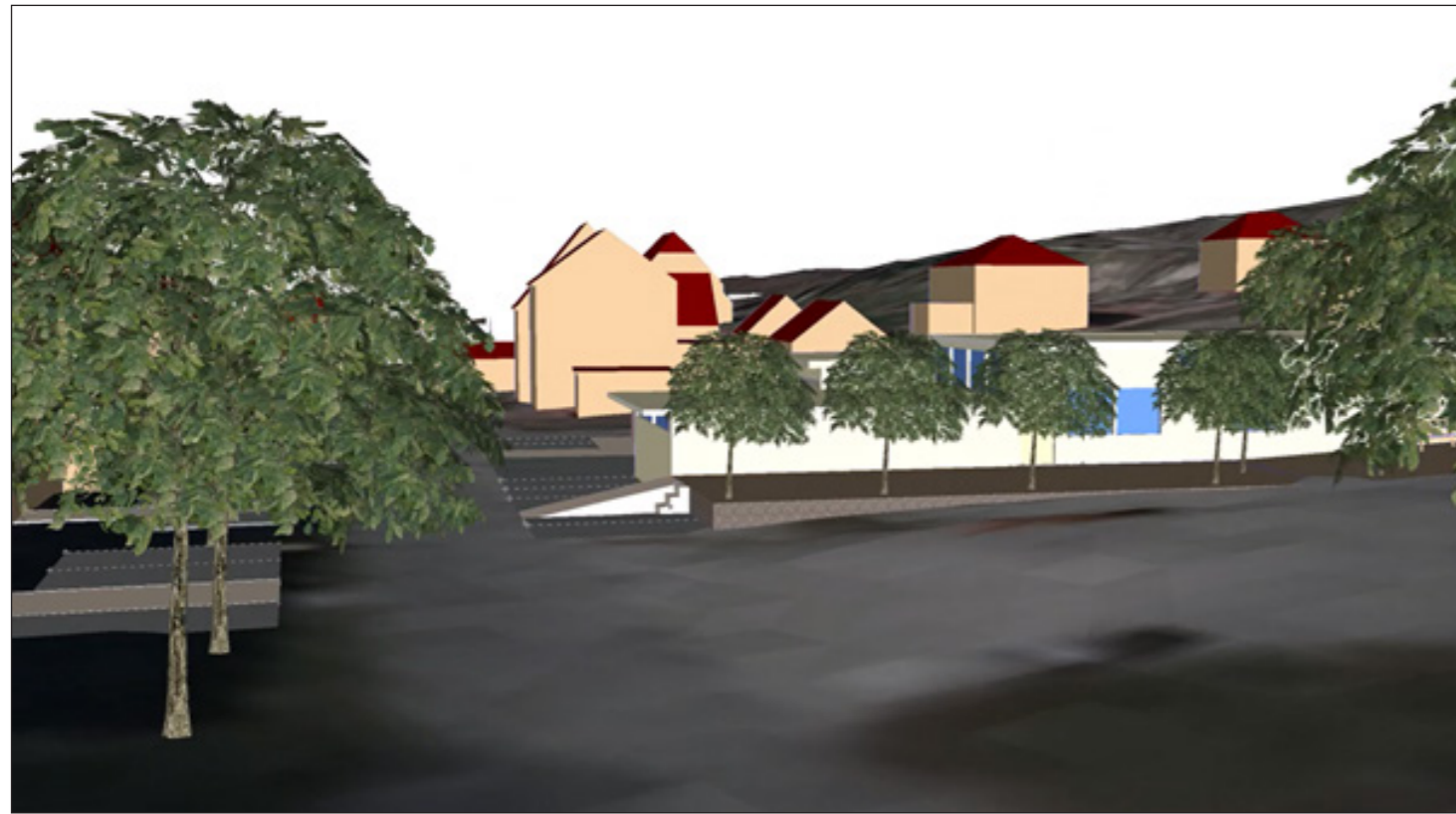
3: Straßensituation mit neuer Baumreihe