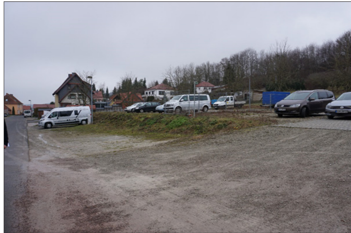
2: Geschotterte und unebene Fläche zwischen Straße und Platz