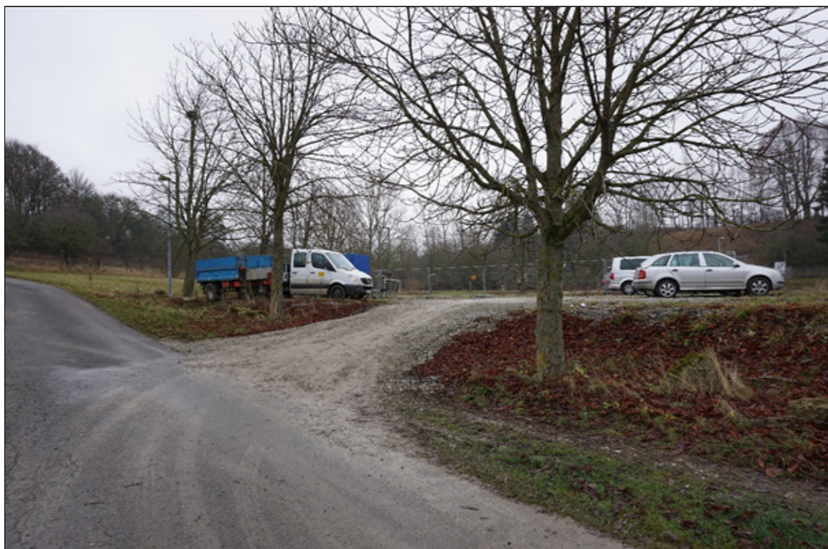
4: Zweite Einfahrt von der Straße „Große Wiese“