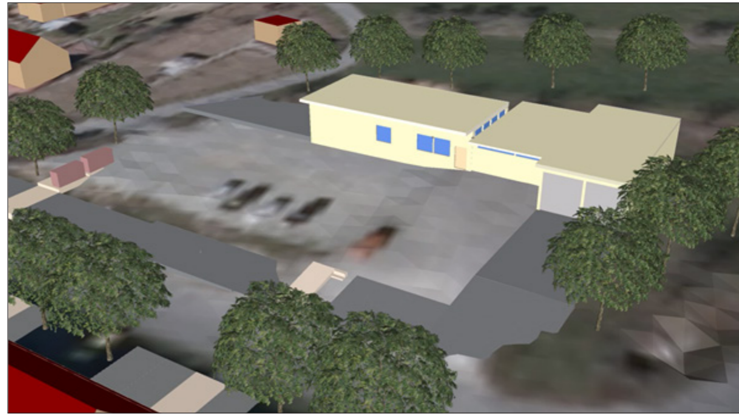
3: Neubauten mit dem Festplatz im Vordergrund