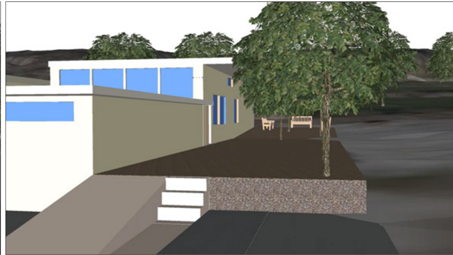
4: Begrünter Vorplatz mit Sitzgelegenheiten