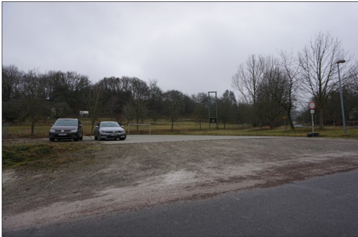
1: Gepflasterter Festplatz mit Zufahrt