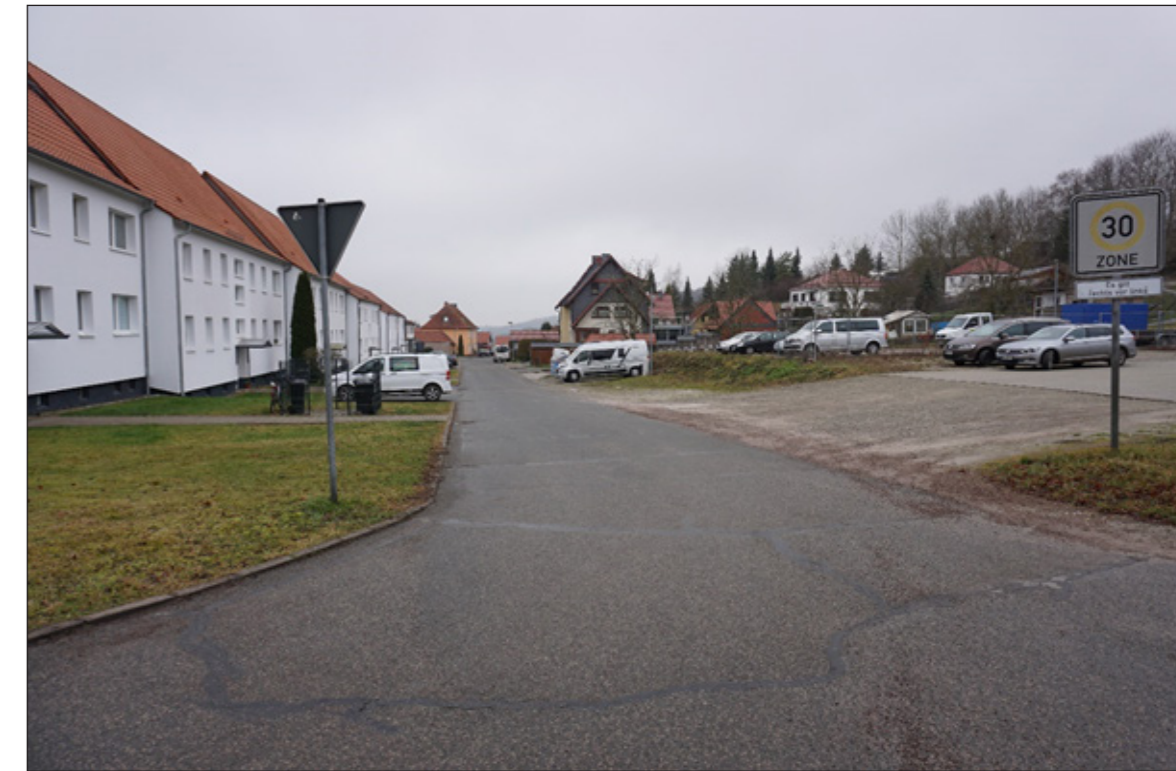
3: Straßensituation aktuell