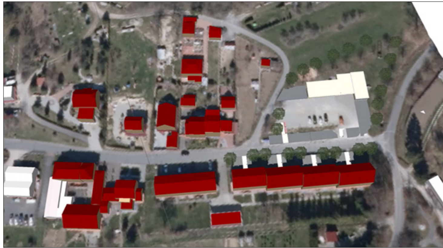
2: Gesamter Geltungsbereich