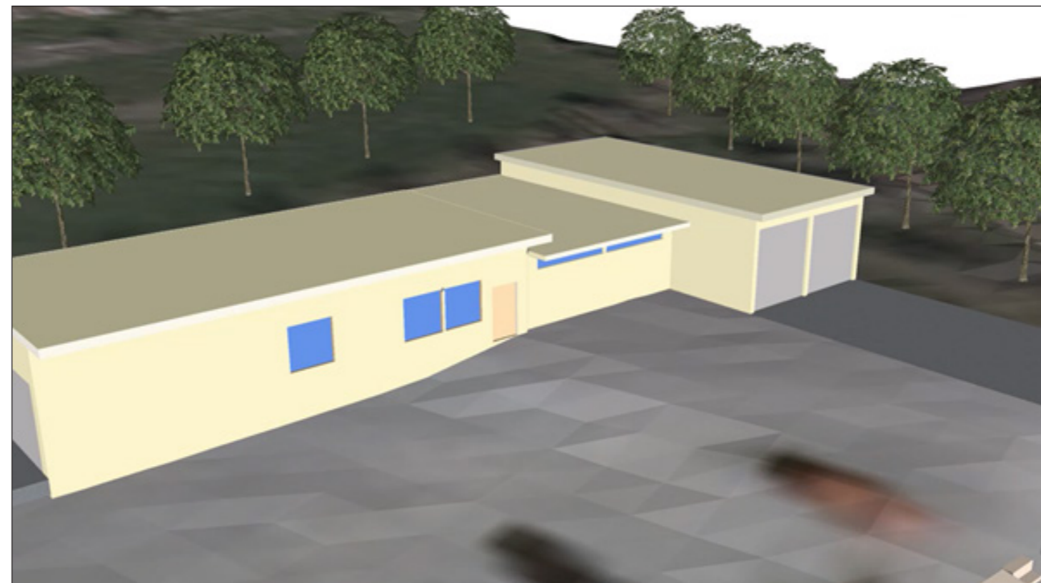
5: Neubau Multifunktionsgebäude