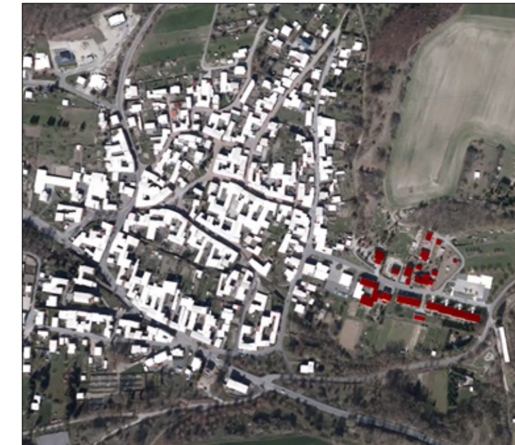
1: Lage in der Ortschaft Kreuzebra