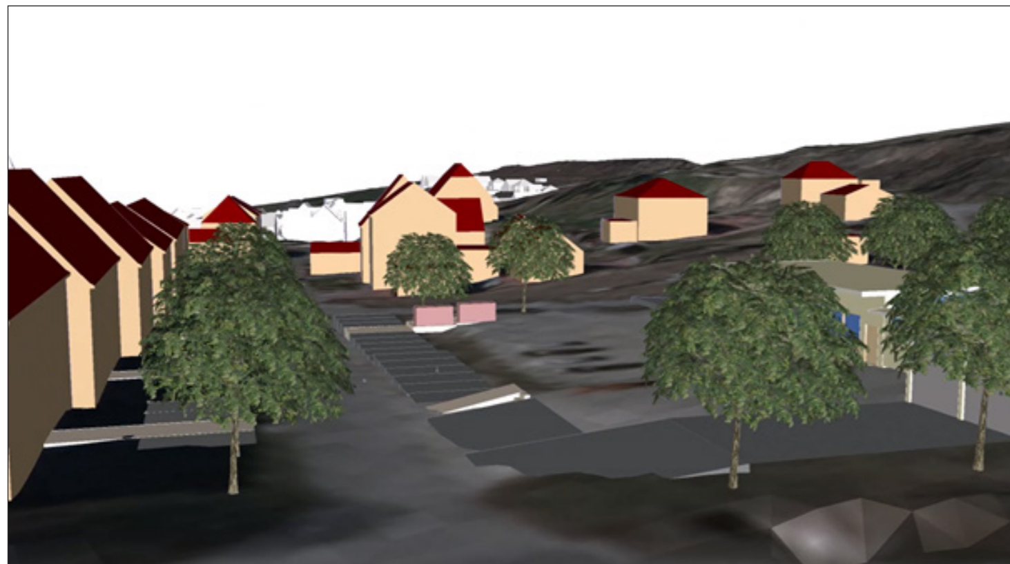
4: Straßensituation mit neuer Baumreihe