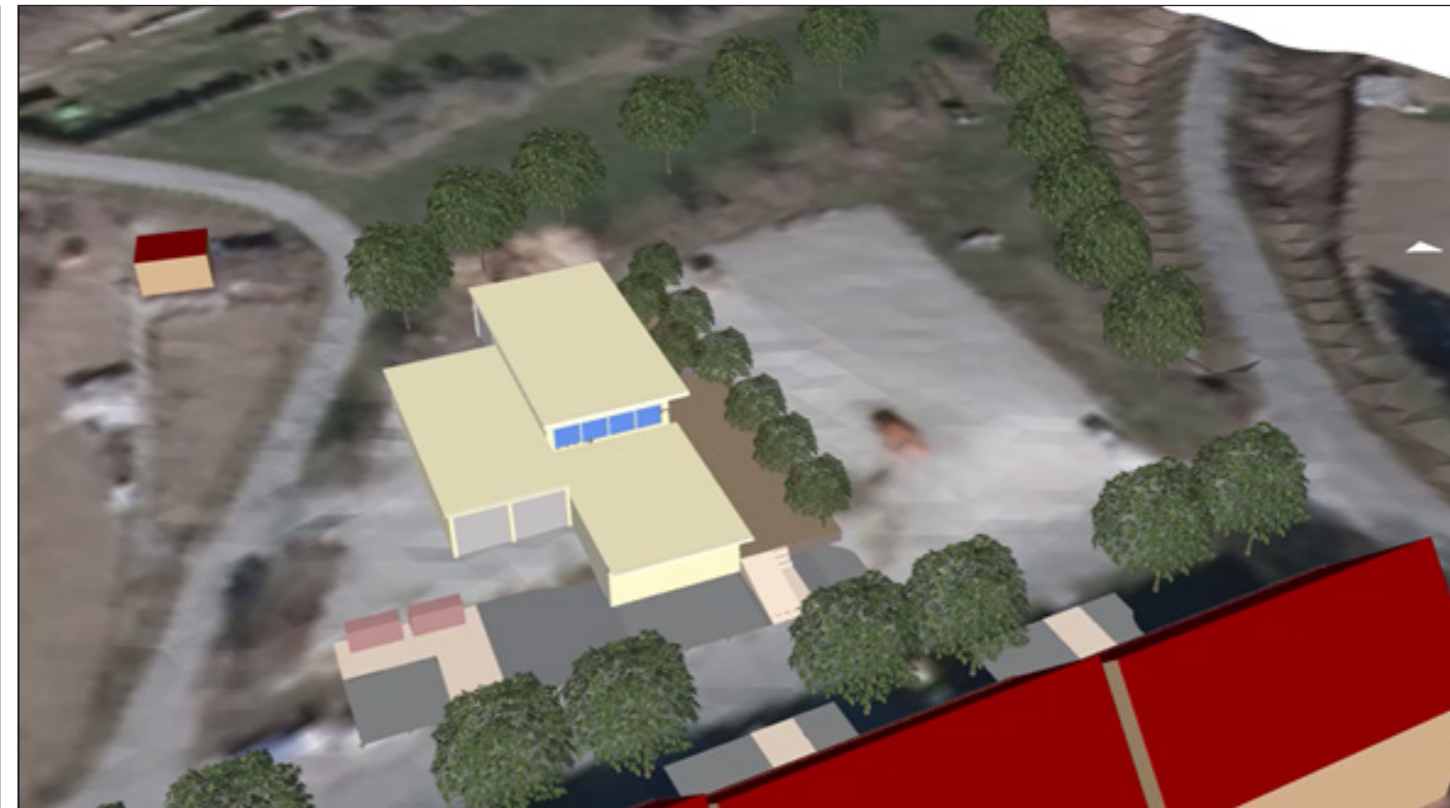
6: Übersicht auf die gesamte Planung