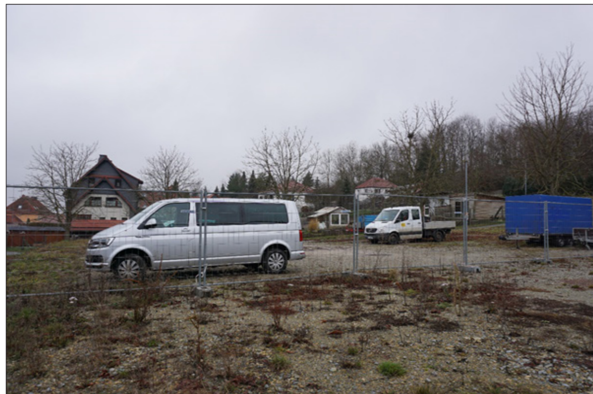
5: Geschotterte Fläche neben dem gepflasterten Festplatz