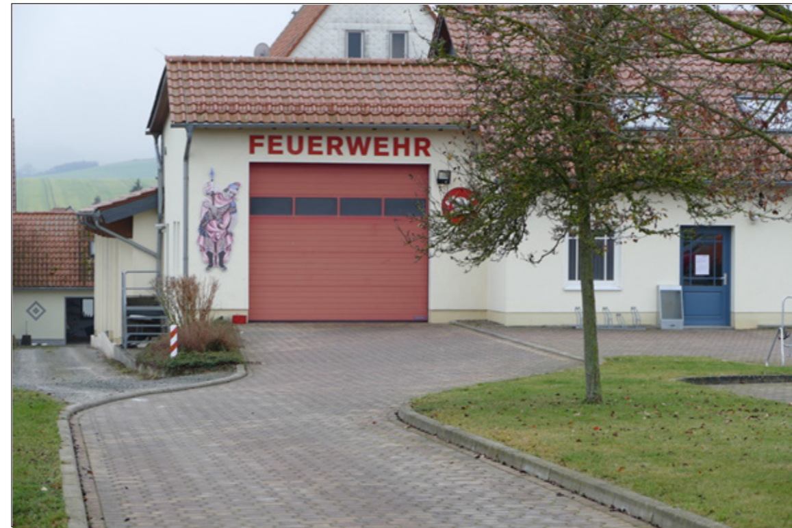
2: Mehrzweckgebäude Feuerwehr und Sportverein