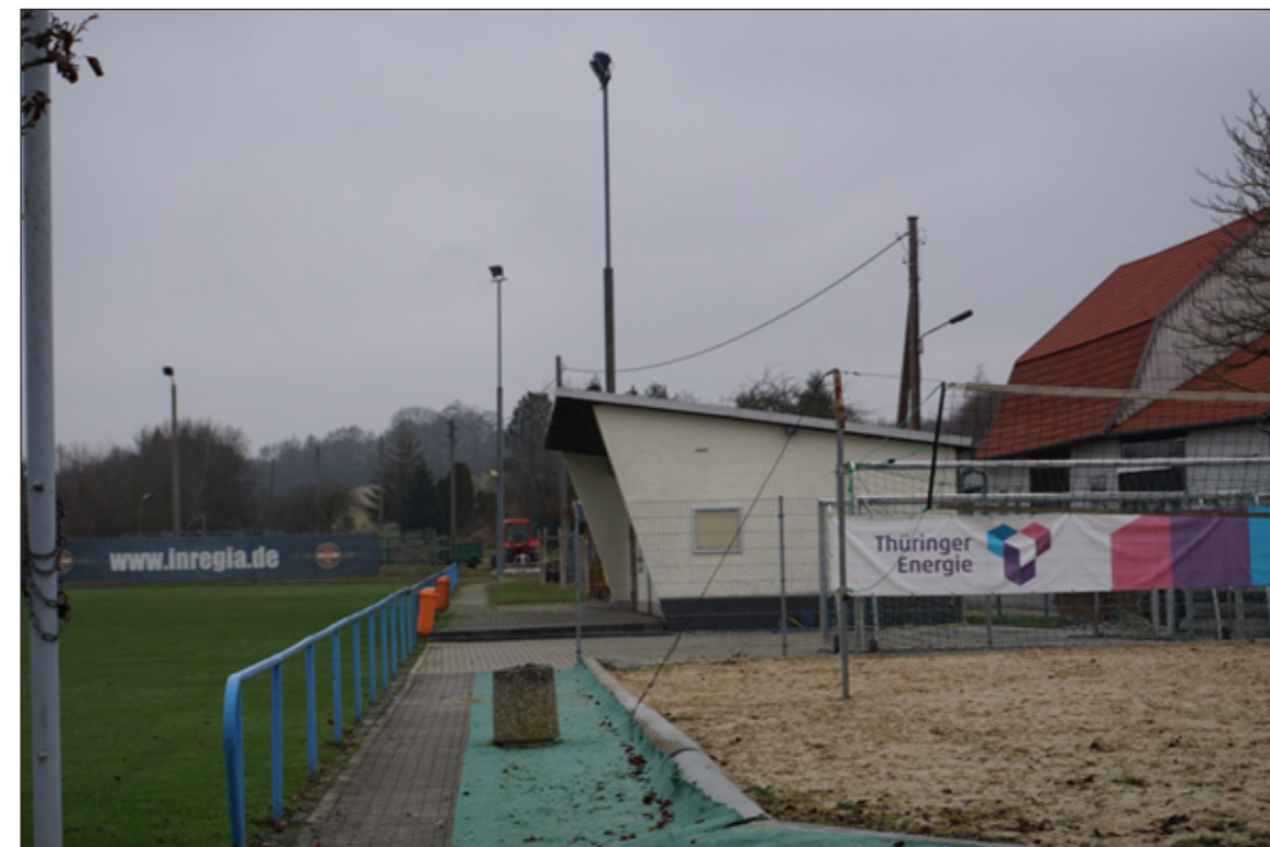
5: Ehemaliges Gebäude Sportverein mit deutlichen baulichen Mängeln