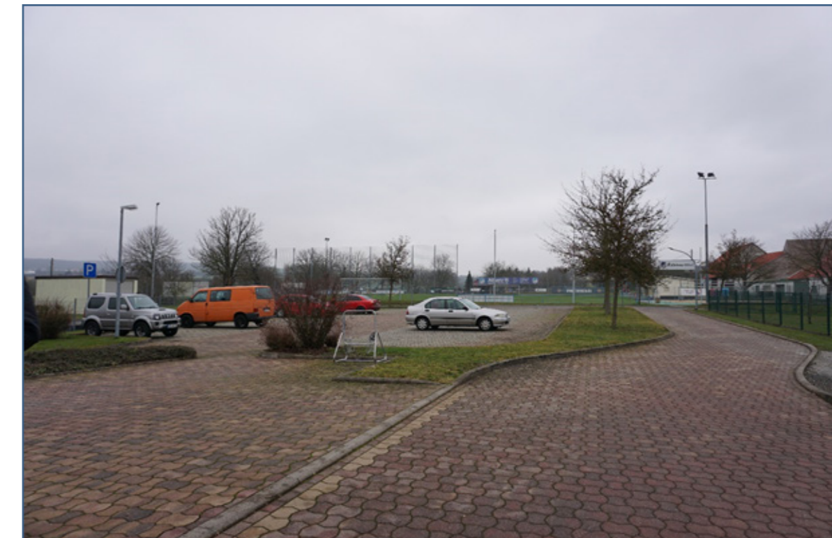
3: Parkplatz im Zentrum des Planungsgebietes