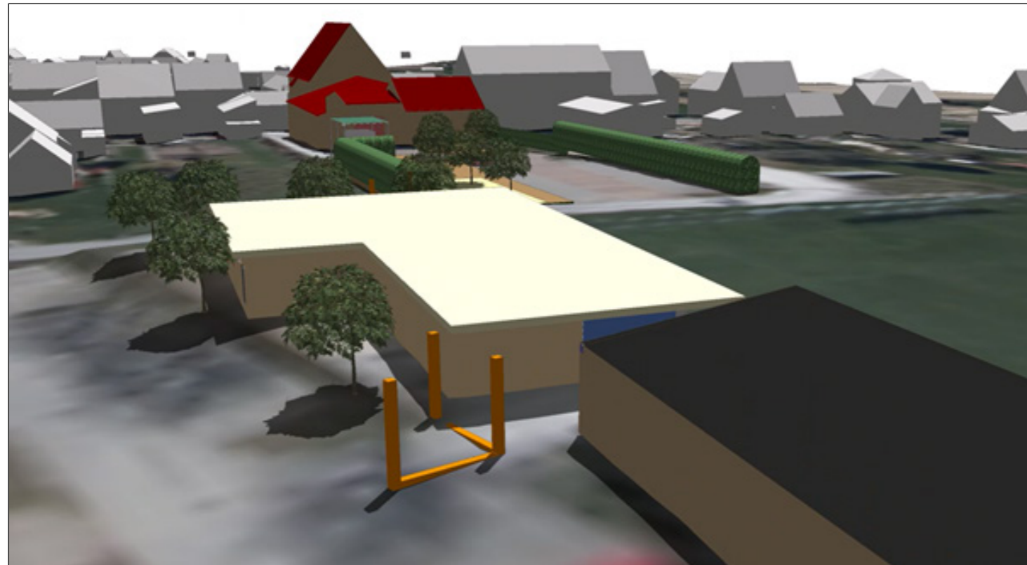
8: Multifunktionsgebäude und räumliches Element Seiteneingang