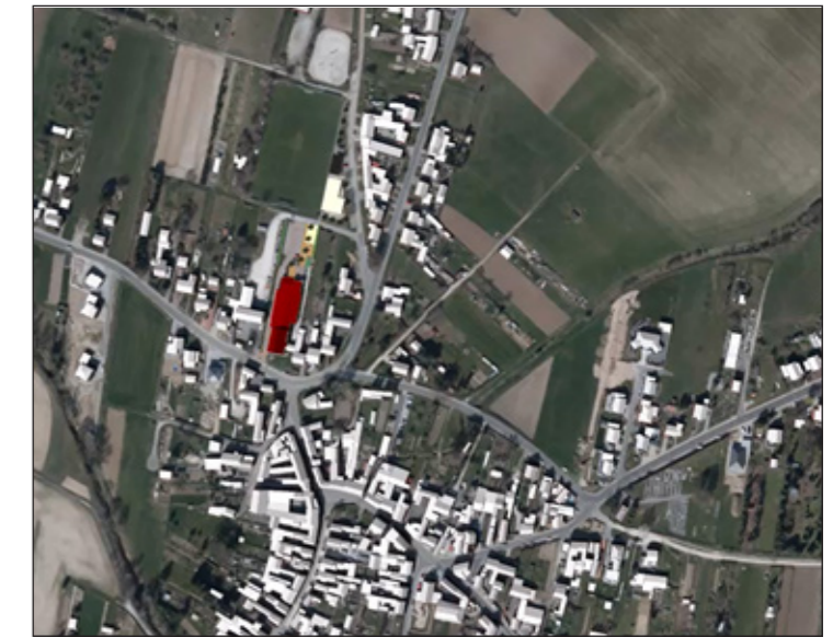
1: Lage in der Ortschaft Silberhausen