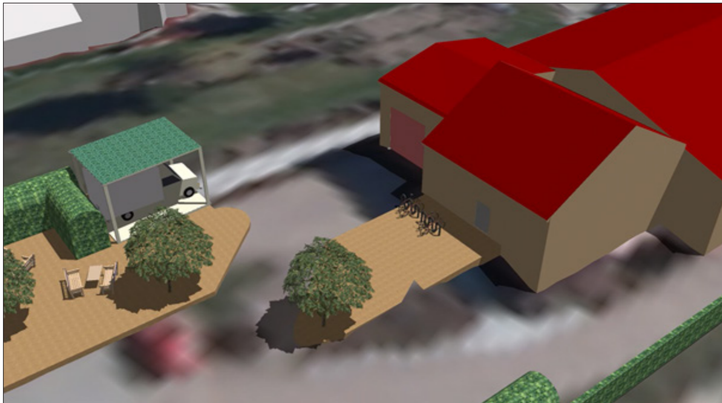
4: Anpassung Feuerwehrezufahrt und Schaffung Carport