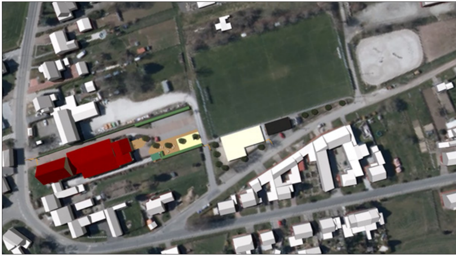
2: Gesamter Geltungsbereich