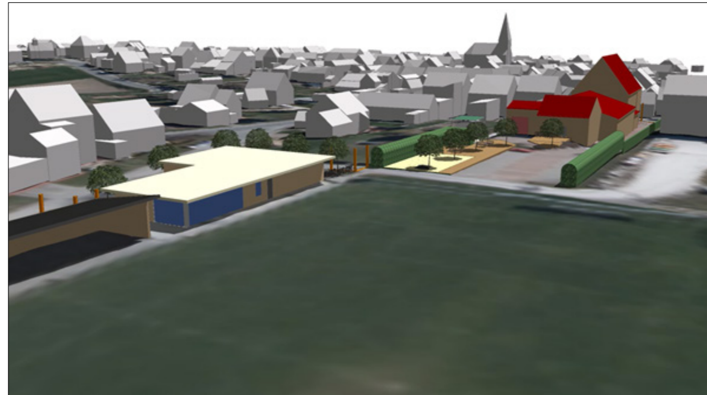
9: Übersicht auf die gesamte Planung