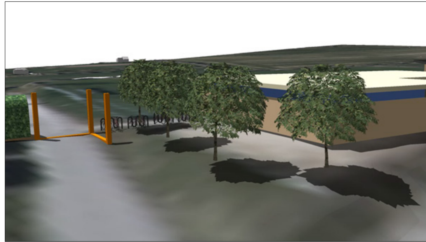
7: Eingangssituation von der Bahnhofstraße