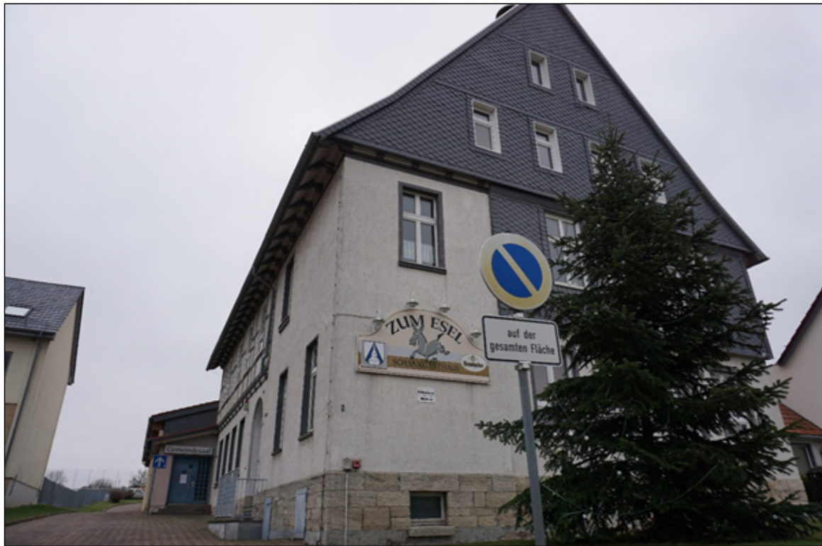
1: Blick auf die ehemalige Gaststätte „Zum Esel“