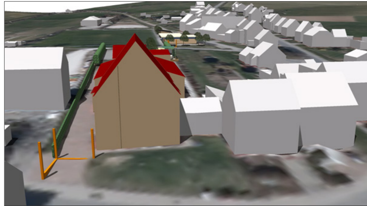
3: Eingangssituation von der Dingelstädter Straße (Hauptdurchfahrtsstraße) mit räumlichem Element